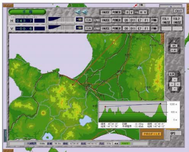
(例)【操作イメージ図 方調制御】