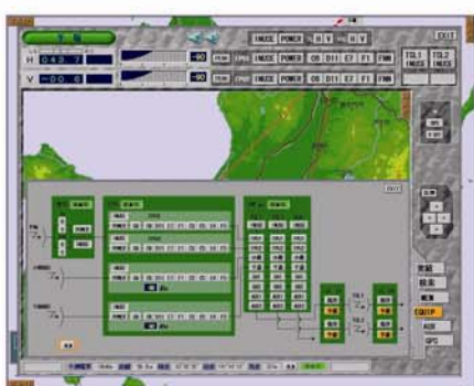
【系統ブロック制御監視画面】