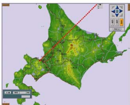
【方向状態表示画面】