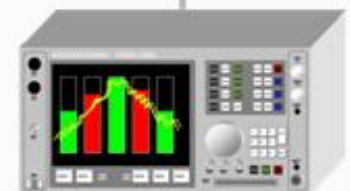
Agilentスペクトラムアナライザ E4446A/E4448A/N1996A