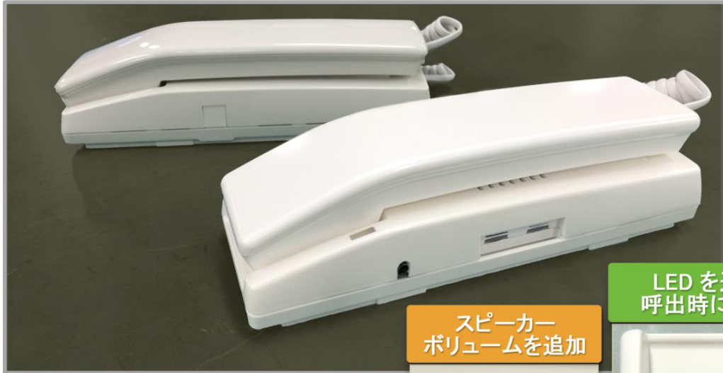
写真手前:ELTEL FT II、後はELTEL FT-4W