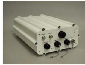
応用例 : CSM2000 MODEM 白山工業㈱様納入品